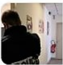
Maison des anciens combattants à Avignon : bras de fer autour du bu... ledauphine.com

@CecileHelle @ledauphine Bonjour Madame le Maire, Que comptez-vous faire pour régler ce contentieux ??? Bien Cordialement KM #Roubaix (Coalition-Harkis.Com) Vaucluse. Maison des anciens combattants à #Avignon : bras de fer autour du bureau des #harkis